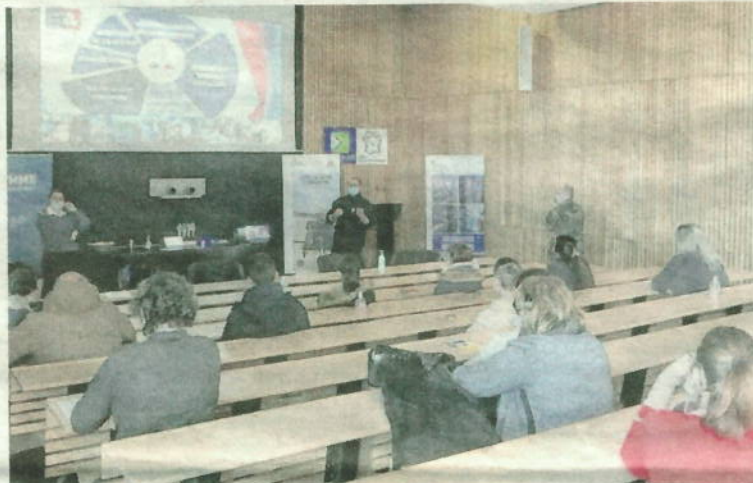
Les trois armées étaient présentes à l'IndustriLAB de Méaulte, hier.